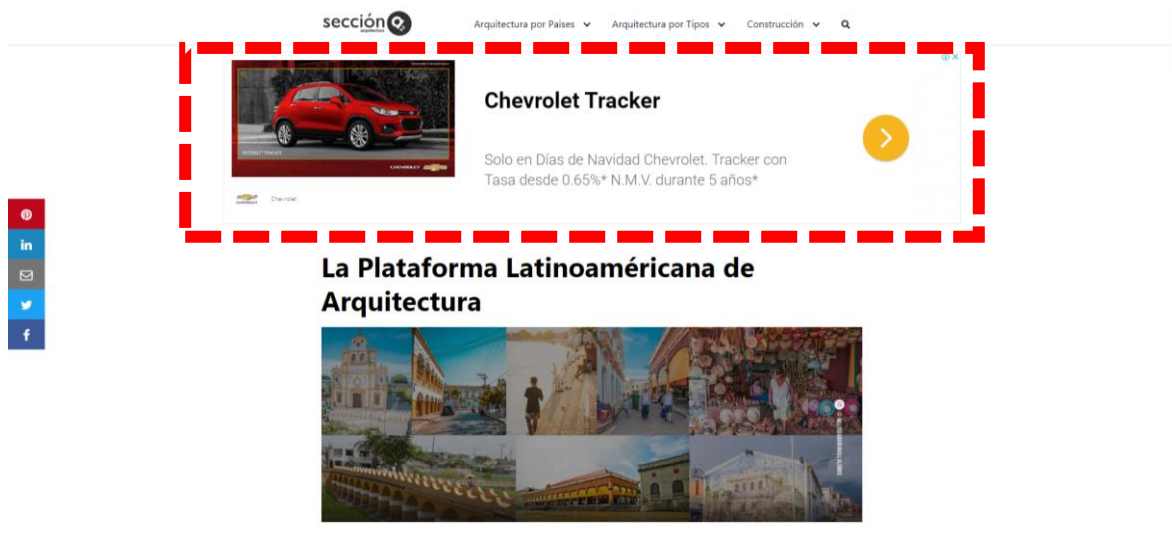
Imagen 1: Banner de publicidad incrustado en la plataforma principal

De esta manera se arma el modelo de Economía Colaborativa, en la que ganan muchos actores; Google, empresas o personas que ofrecen un producto o servicio, dueños de Blogs y usuario final que busca un servicio o producto en internet.